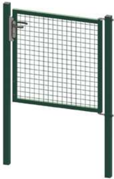
Egidia M50 Drehtore