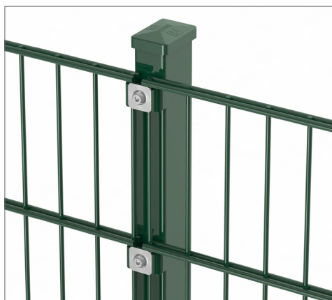
mit Befestigungsplättchen aus Edelstahl